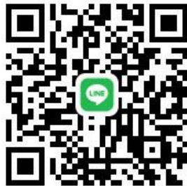
介護複合施設ハーブス