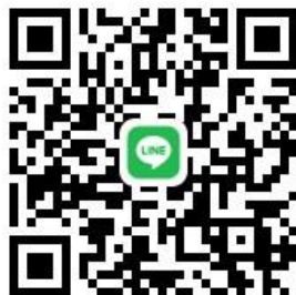
ショートステイユウカリ